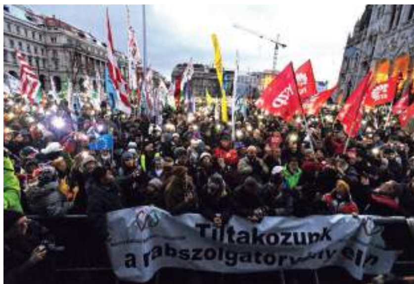
Manifestants hongaresos contra la llei d'esclavatge

una base econòmica en la xenofòbia de certs sectors de la classe treballadora i petita burgesia que veuen en la competència d'europaus de l'est el motiu dels seus problemes econòmics. De nou, en lloc de lluitar per canviar la societat tot enfrontant-se amb el poder de la burgesia, hom actua contra qui, empès per la crisi econòmica del seu país, es veu obligat