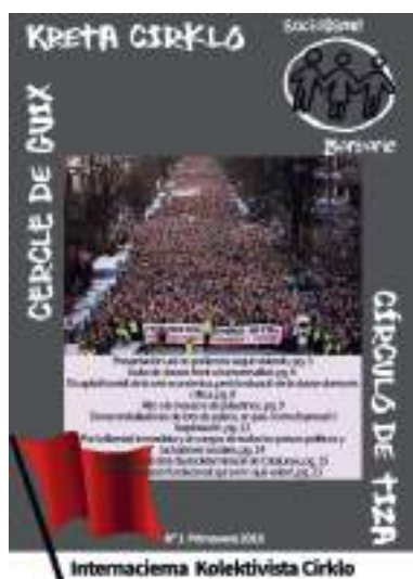
Kreta cirklo no. 1 Primavera 2018

http://www.ikcirklo.org/erojn/revista/no1-2018-primavera/