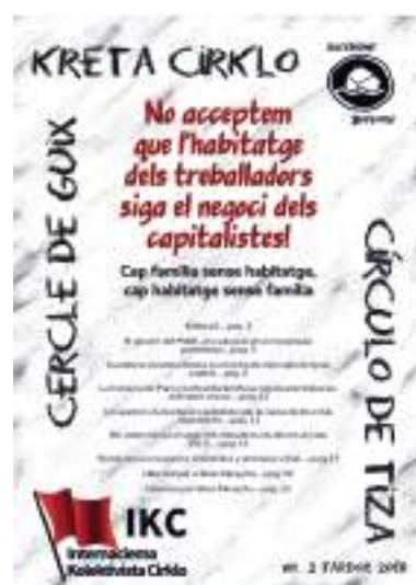
Kreta cirklo no. 2 Tardor 2018

http://www.ikcirklo.org/erojn/revista/no1-2018-primavera/