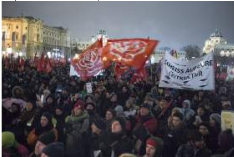
Manifestació en Austria contra el govern d'extrema dreta, 15 Desembre 2018

descobriran que el neofeixisme no li soluciona res